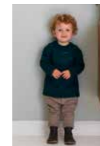
MINSTEN GENSER 15