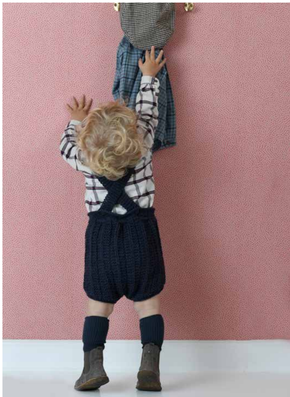
1722 | BABY LAMA | X5 | 17/10 | •• SMEKKEROMPER | 1/2-4 ÅR