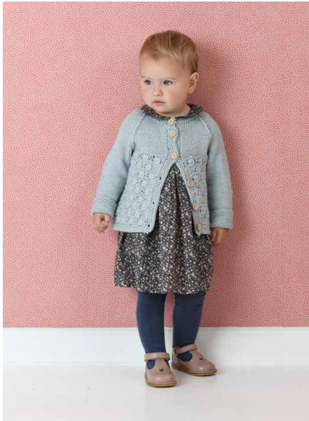
1722 | BABY LAMA | 5 | 17/10 | •• BLOMSTERKNOPPJAKKE 5 | 17/10 | 1/2-4 ÅR