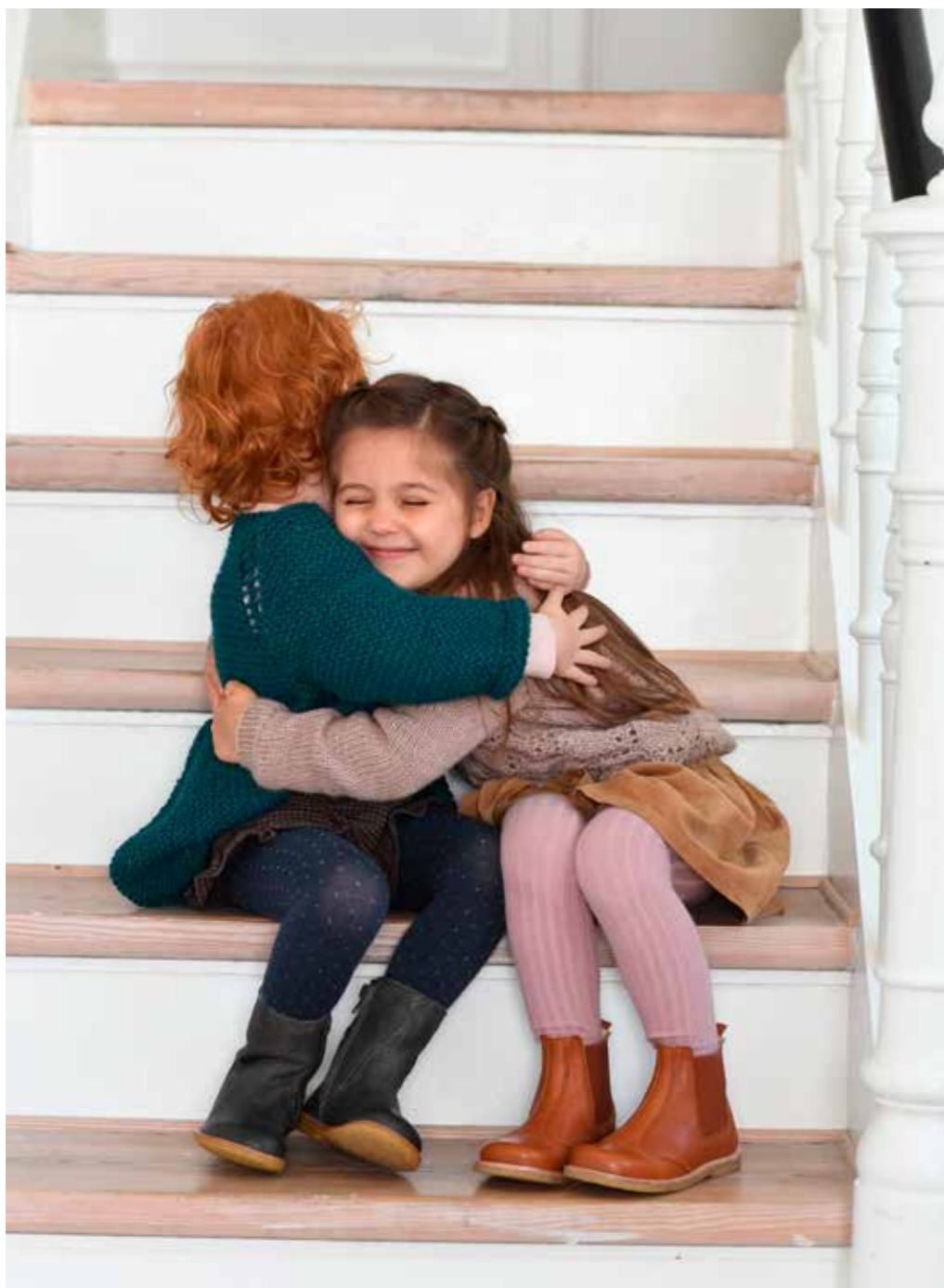
1722 3 | BABY LAMA | \times 5\frac{1}{2} | \frac{15}{10} | • RILLEJAKKE 0-4 ÅR