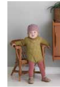
KLOKKEBODY KLOKKE LUE 9