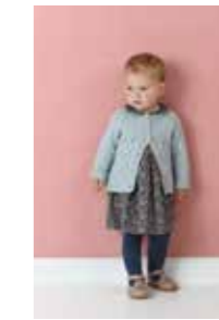
BLOMSTERKNOPP JAKKE 5