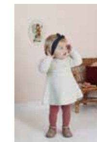
MINSTEN KJOLE 16