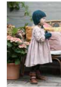
FLETTE LUE FLETTEVOTTER 6