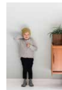
I-CORD JAKKE, LUE 14